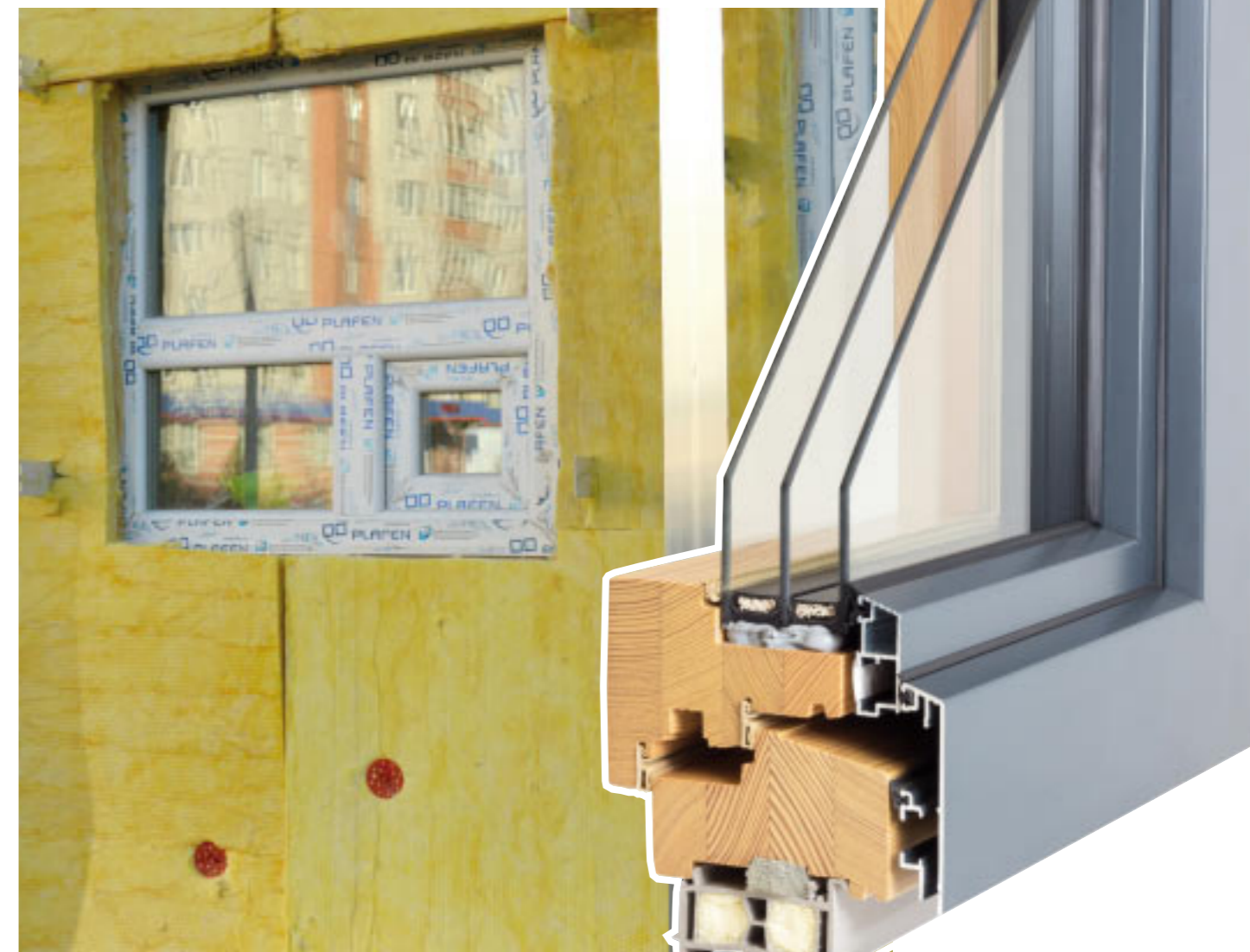
Aus energetischer Sicht die größten Schwachstellen eines Gebäudes: Türen und Fenster. Letztere gibt es inzwischen mit dreifach Isolierverglasung in Rahmen mit Mehrkammerprofilen

Neben dem Entwurf und einer Baukonstruktion umfasst das „Energieoptimierte Bauen“ also eine Konzeption für eine natürliche Klimatisierung und die Entwicklung von klimaaktiven Fassaden. Bis hin zu optimierten Türen und Fenstern, denn sie sind aus energetischer Sicht die größten Schwachstellen eines Gebäudes. In Holz-, Holz-Metall- oder Kunststoff-Rahmen mit